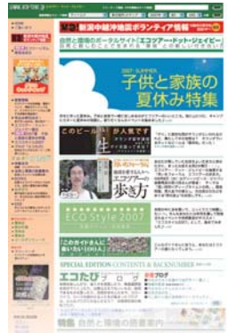
エコツアー・ドット・ジェイピー